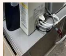
ドレインパン(受け皿)